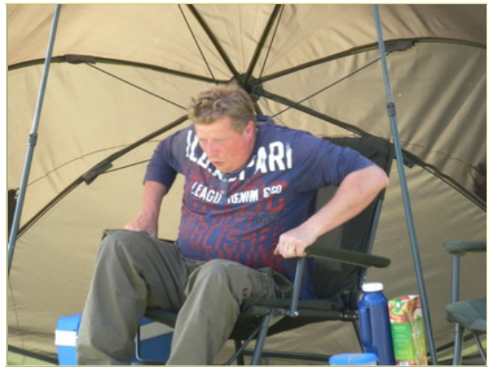
Piepertje trekken, het blijft leuk. Je kan de tekst van het 'slachtoffer' bijna invullen .....