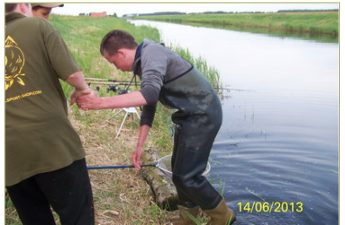
Team "Die Biggie Fisherman", 3 vissen op de mat.