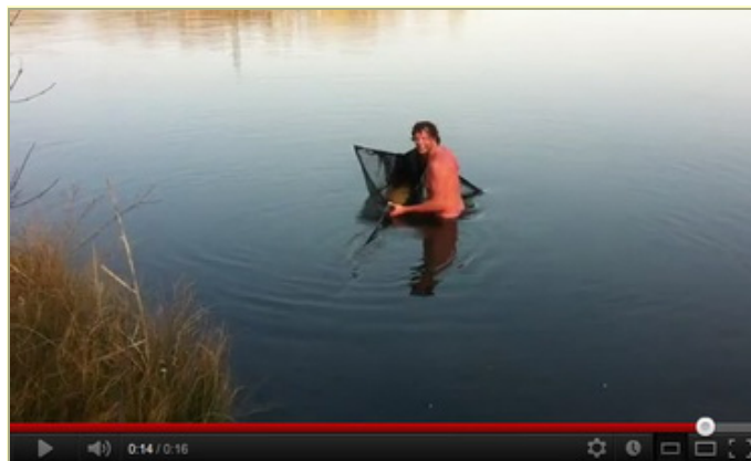
Check hierboven het filmpje van "de dappere duiker!!"