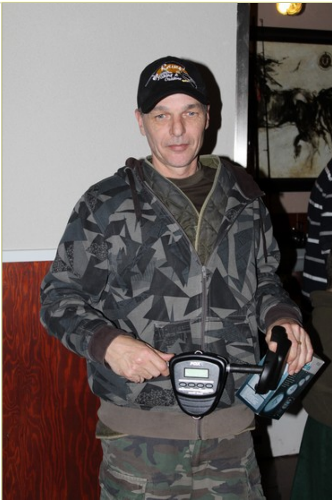
Johnny ging naar huis met een digitale weger van Fox.