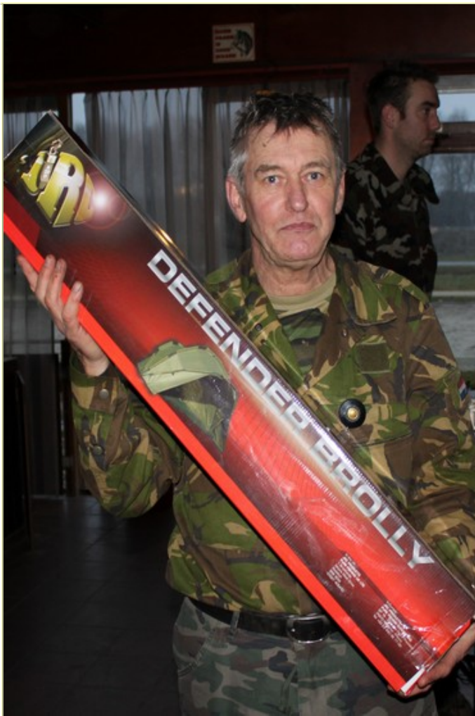
Jan koos voor een mooie JRC brolly.