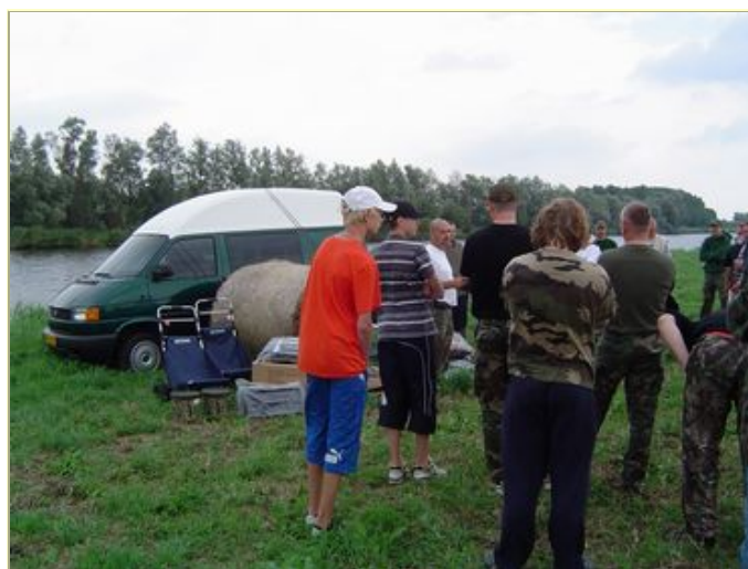
Altijd leuk, een prijsuitreiking.