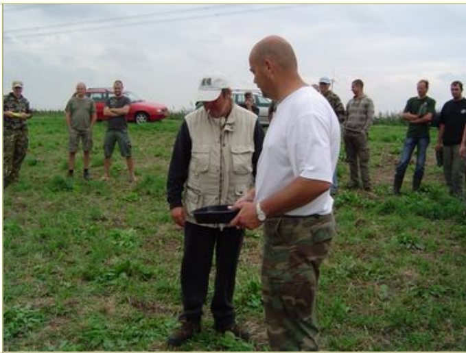
Rene en Jaqueline (niet op de foto).