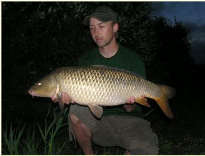
Mark deed ook weer goed mee .....