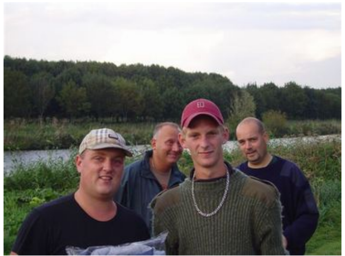
En ook voor de laatste 4 deelnemers die vis hadden gevangen waren er mooie prijzen, variërend van sweaters en (hengelsport) klokken tot koffiezetapparaten.