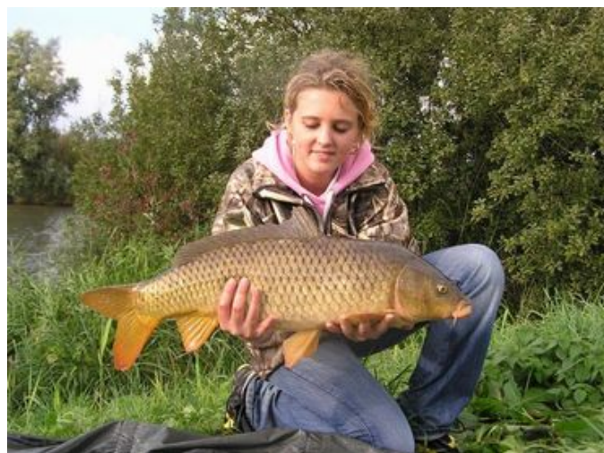
..... maar ook dit koppel kon gelukkig aan de slag..... ik heb de foto aan mijn vrouw laten zien, zo van: "zie je wel, het kan wel!" maar mijn vrouw gaat nog steeds niet met me mee vissen.