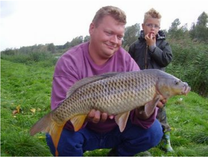
Sybe, 62 cm en 8 pond (en deze keer de hele wedstrijd uitgevist)