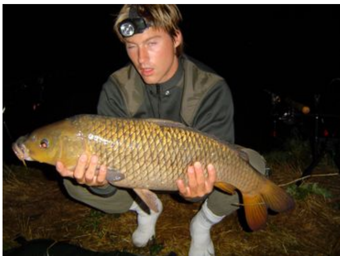
Marinus, 78 cm en 14.6 pond.