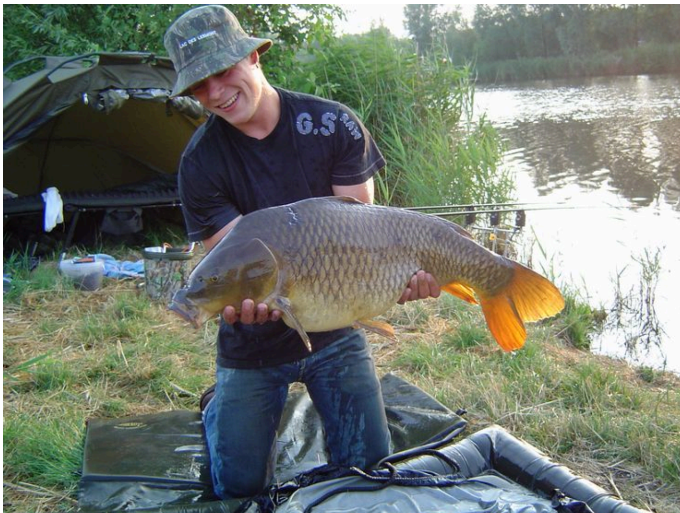
Dicky met de zwaarste van de wedstrijd: 80 cm en 19.8 pond. Een schitterende vis!