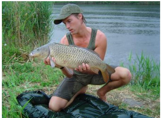
Marinus, 70 cm en 11 pond.