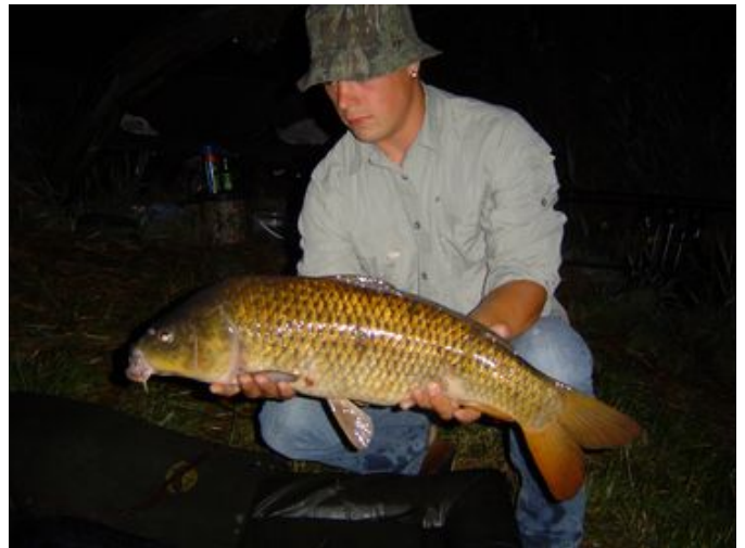
Dicky, 70 cm en 11.6 pond