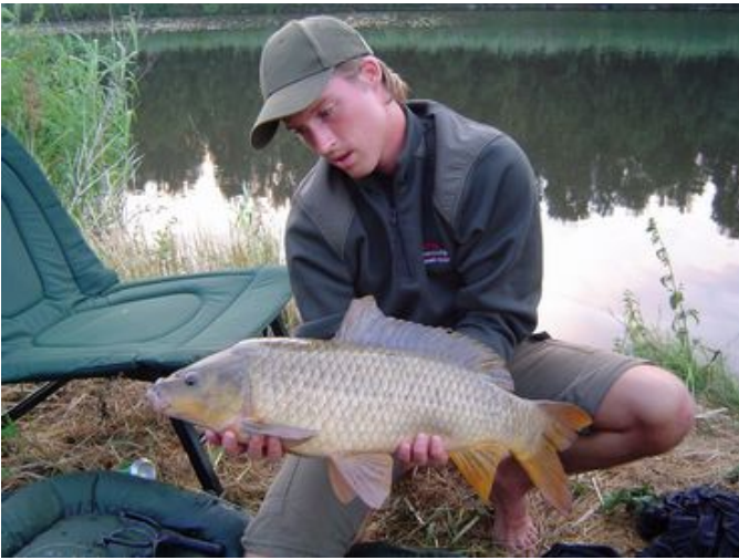
Marinus, 68 cm en 8.8 pond.