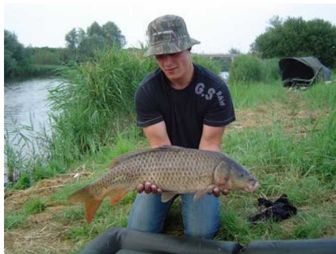
Dicky 73 cm en 10.4 pond