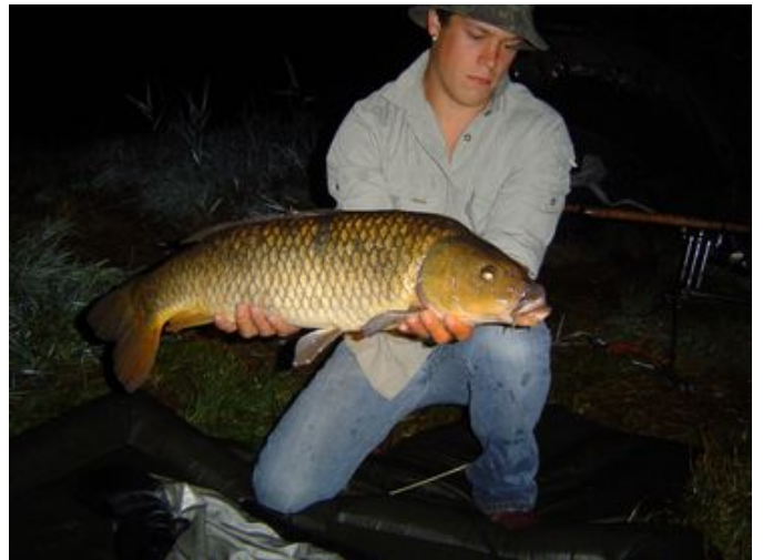
Dicky, 75 cm en 12.8 pond