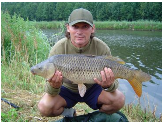
Marcel, 69 cm en 9.5 pond