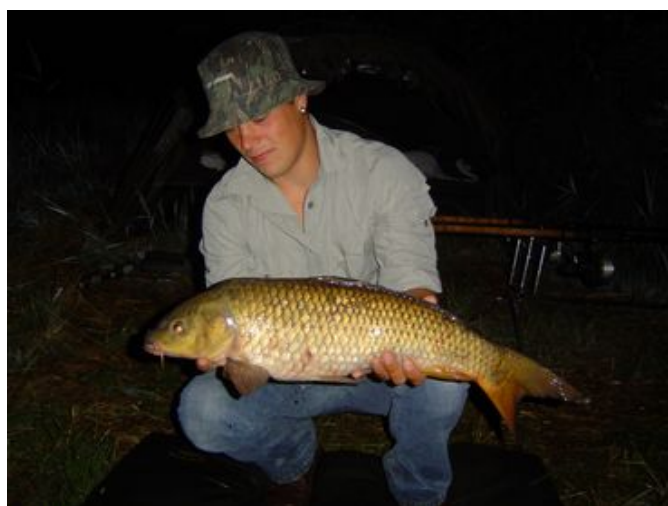
Dicky, 68 cm en 8.8 pond