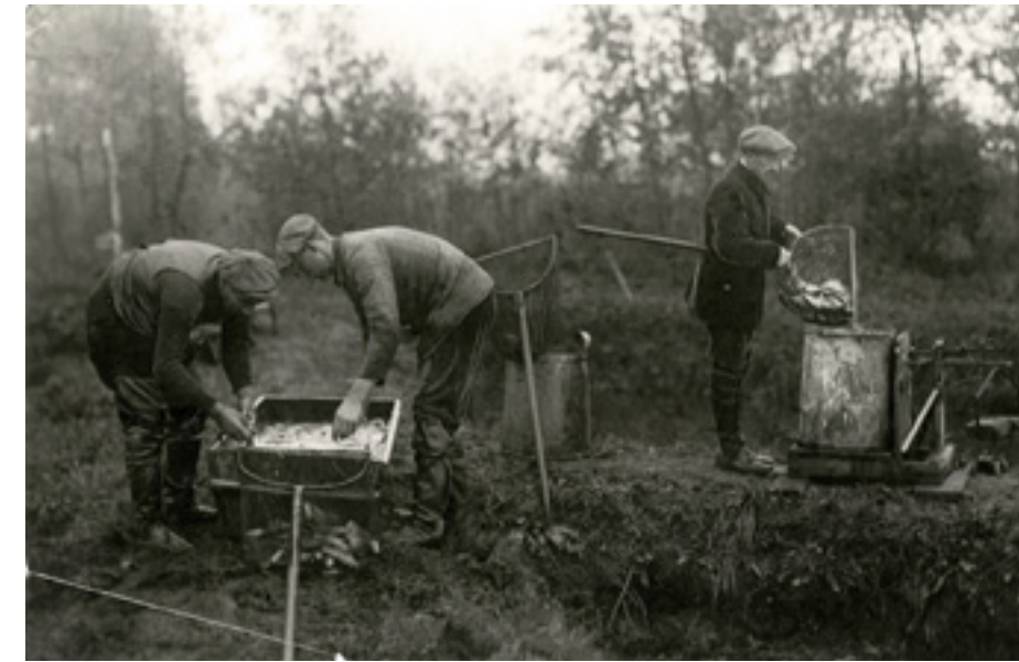
De afgeviste tweejarige karpers worden aan de vijver in Vaassen gesorteerd en gewogen op een bascule.

In de winter van 1902-1903 wordt het vijvercomplex bij Vaassen uitgebreid met nog eens 8 hectare water. De productie neemt verder toe en in 1904 kunnen ruim 130.000 eenjarige karpers worden geoogst; maar liefst 40.000 stuks meer dan in het voorgaande jaar. Net als in het buitenwater, heeft de Heidemaatschappij op de kweekvijvers te kampen met een forse uitval onder de jonge vis, tot wel 90%. Vooral de periode na het overzetten van het broed in de strekvijvers is kritiek. Zo maakt "een ontelbaar aantal" kikkers direct jacht op het visbroed. Dagelijks worden