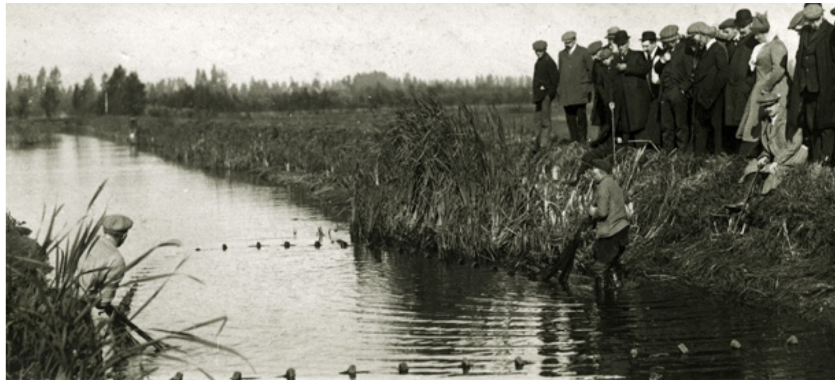
Kweekvijver in Vaassen met toeschouwers aan de waterkant, begin 1900.