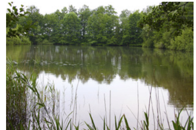
De Vaassense kweekvijvers liggen er vandaag de dag nog steeds schitterend bij.