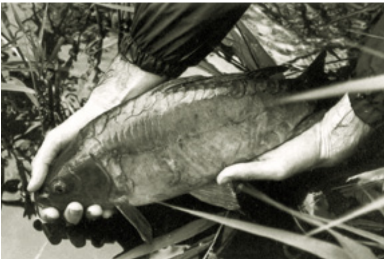
Karpers worden het belangrijkste kweekproduct.

er enkele nieuwe vijvers aangelegd. Door het pachten van twee bestaande vijvers bij Bergeijk beschikt de Heidemaatschappij in 1948 over vijf viskwekerijen. De Staat der Nederlanden gaat de exploitatiekosten dragen en de pootvis wordt voortaan door het zogenaamde Rijkspootvisfonds beschikbaar gesteld voor uitzettingsdoeleinden. Vanuit de hengelsportverenigingen is er een steeds verder toenemende vraag naar pootvis. Dit blijkt van beslissende betekenis te zijn voor de verdere ontwikkeling van de visteelt en de karperuitzettingen in Nederland. De viskwekerijen gaan op volle toeren draaien en karpers zijn het belangrijkste kweekproduct. In de volgende jaren zullen grote hoeveelheden karper in de Nederlandse wateren worden uitgezet.